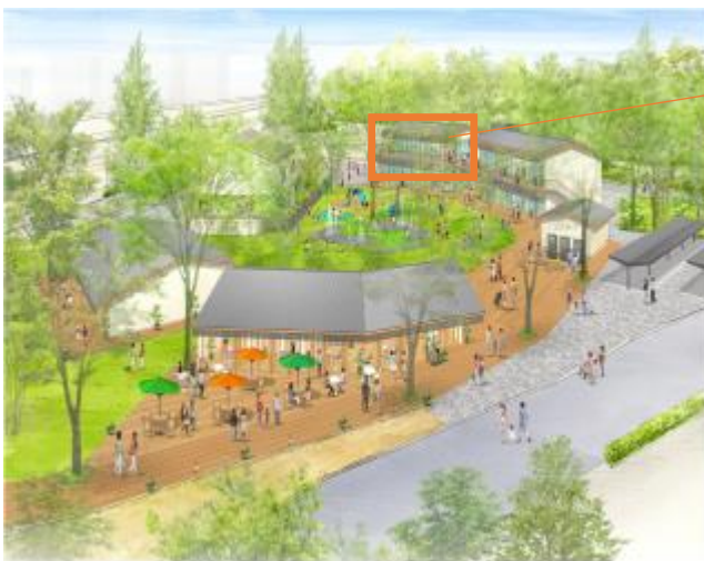
<鶴舞公園正面南エリア>